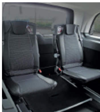
Optionale Dreh-Klappsitze in dritter Reihe ermöglichen eine flexible Nutzung des Fahrzeuges.