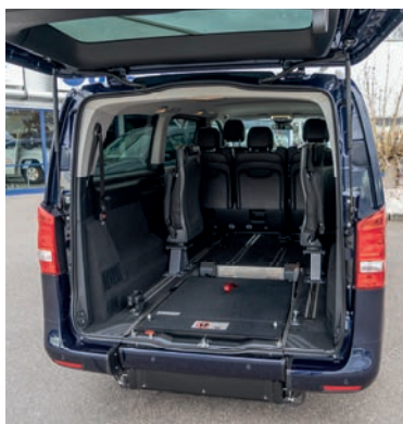
Die eingeklappte EASYFLEX Rampe ermöglicht die volle Nutzung des Kofferraums.