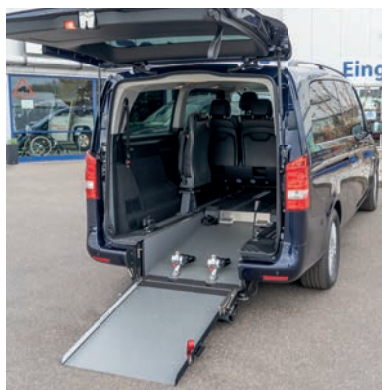
Bei ausgeklappter Rampe lässt sich das Fahrzeug bequem mit dem Rollstuhl befahren.