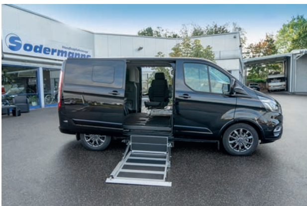
Einfach mit dem Rollstuhl in das Auto hineinfahren