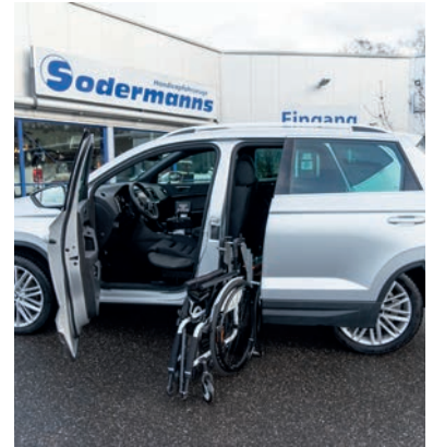
Voll autom. Rollstuhlverladung