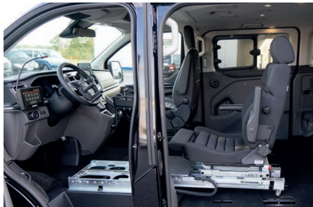
6-Wege-Konsole: vor, zurück, rauf, runter, drehen: li + re