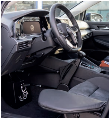
Transferhilfe - Rutschbrett